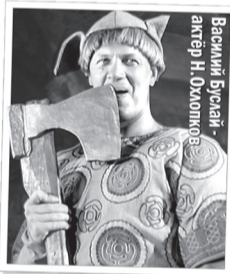
Актёр В. Охлопков

В отличие от «ненастоящей» зимы, зимняя одежда: тулупы, шапки, рукавицы простых русских воинов были вполне реальными.