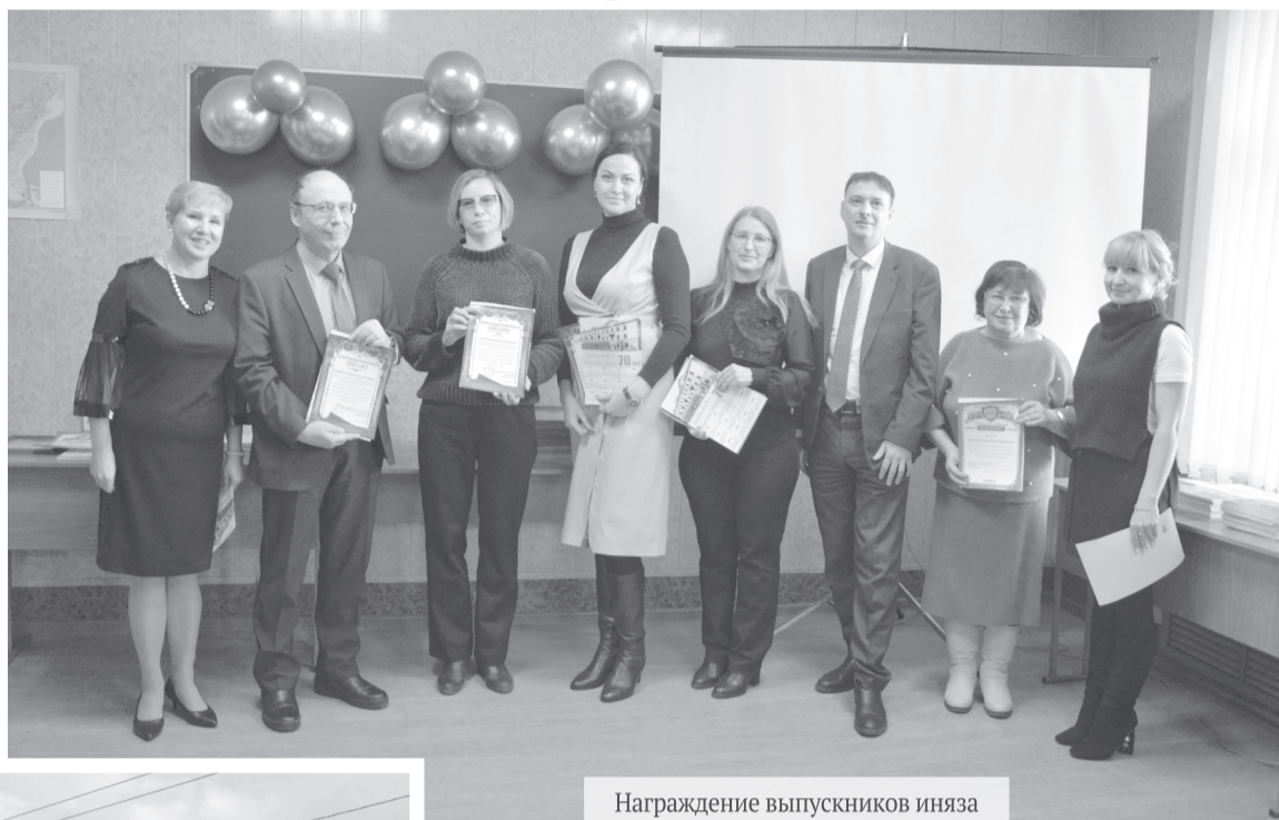
Награждение выпускников иняза

— Я получил подготовку на кафедре китайского языка, что позволило мне определиться с дальнейшей профессиональной деятельностью. Работаю в си-