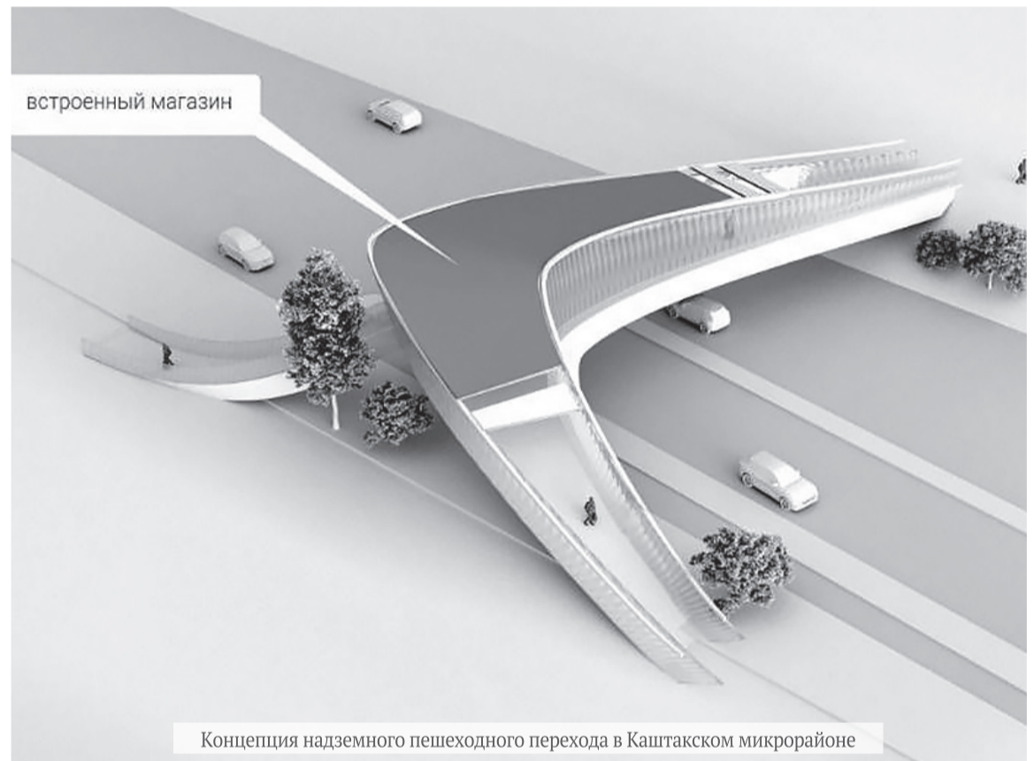
Концепция надземного пешеходного перехода в Каштакском микрорайоне