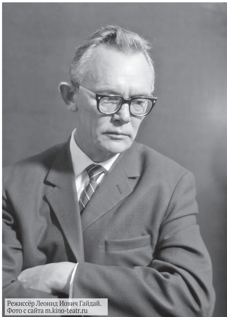
Режиссёр Леонид Иович Гайдай.

30 января исполнилось сто лет со дня рождения Леонида Гайдая — одного из самых популярных советских кинорежиссёров. Среди читателей нашей газеты вряд ли найдётся тот, кто по много раз не пересматривал его культовые комедии: «Операция «Ы» и другие приключения Шурика», «Кавказская пленница», «Бриллиантовая рука», «12 стульев», «Иван Васильевич меняет профессию», «Не может быть!». Однако мало кто знает, что раннее детство Леонида Гайдая прошло в нашем городе.