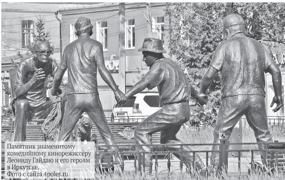
Памятник знаменитому комедийному кинорежиссёру Леониду Гайдаю и его героям в Иркутске.