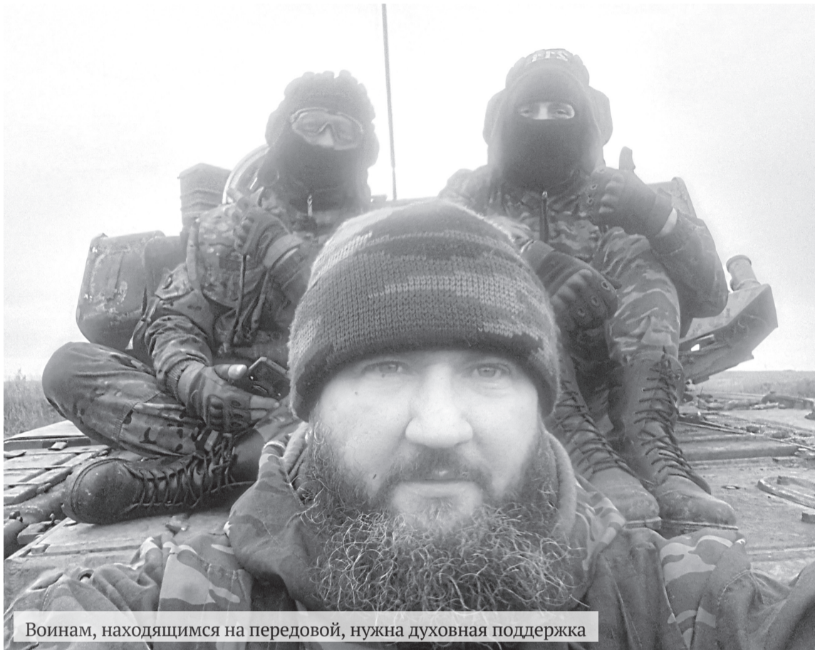
Воинам, находящимся на передовой, нужна духовная поддержка

Многие через молитву и покаяние, находясь в местах лишения свободы, обретают веру и не теряют её, выйдя на свободу, вновь подвергаясь соблазнам и искушениям. После освобождения они чаще остальных создают семьи, работают, помогают тюремным священнослужителям в окормлении осу-