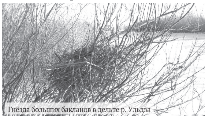
Гнёзда больших бакланов в дельте р. Ульды

В ходе прошлого наполнения Торейских озёр, в 1990-х годах, важнейшими местами гнездования больших бакланов и серых цапель были открытые, покрытые степной растительностью острова, а также почти непроходимые заросли тростников и кустов ивы в обширных плавнях заболоченной дельты реки Ульды. Выявление и учёт гнёзд в дельте в весенне-летний период чрезвычайно осложнены по причине труднодоступности этих мест. Кроме того, беспокойство птиц в результате посещения человеком гнездовых колоний в