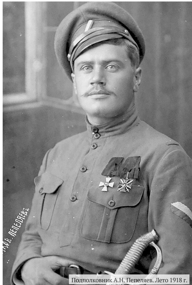
Подполковник А.Н. Пепеляев. Лето 1918 г.

На подступах к Амге дорогу Пепеляеву преградил небольшой отряд красного командира анархиста И.Я. Строда. Длительная «ледяная осада» якутского селения Сасыл-Сысы (бои продолжались с 13 февраля по 3 марта 1923 года) стала последним крупным противостоянием Гражданской войны. Красные дождалась подкрепления, и теперь уже отряд Пепеляева вынужден был отступать по направлению к охотскому побережью. Во избежание продолжения кровопролития оставшимся в живых добровольцам Пепеляев приказал сдать, и лишь небольшая часть отряда на японских рыболовецких судах смогла вернуться в Маньчжурию. А в