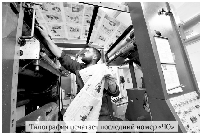
Типография печатает последний номер «ЧО»