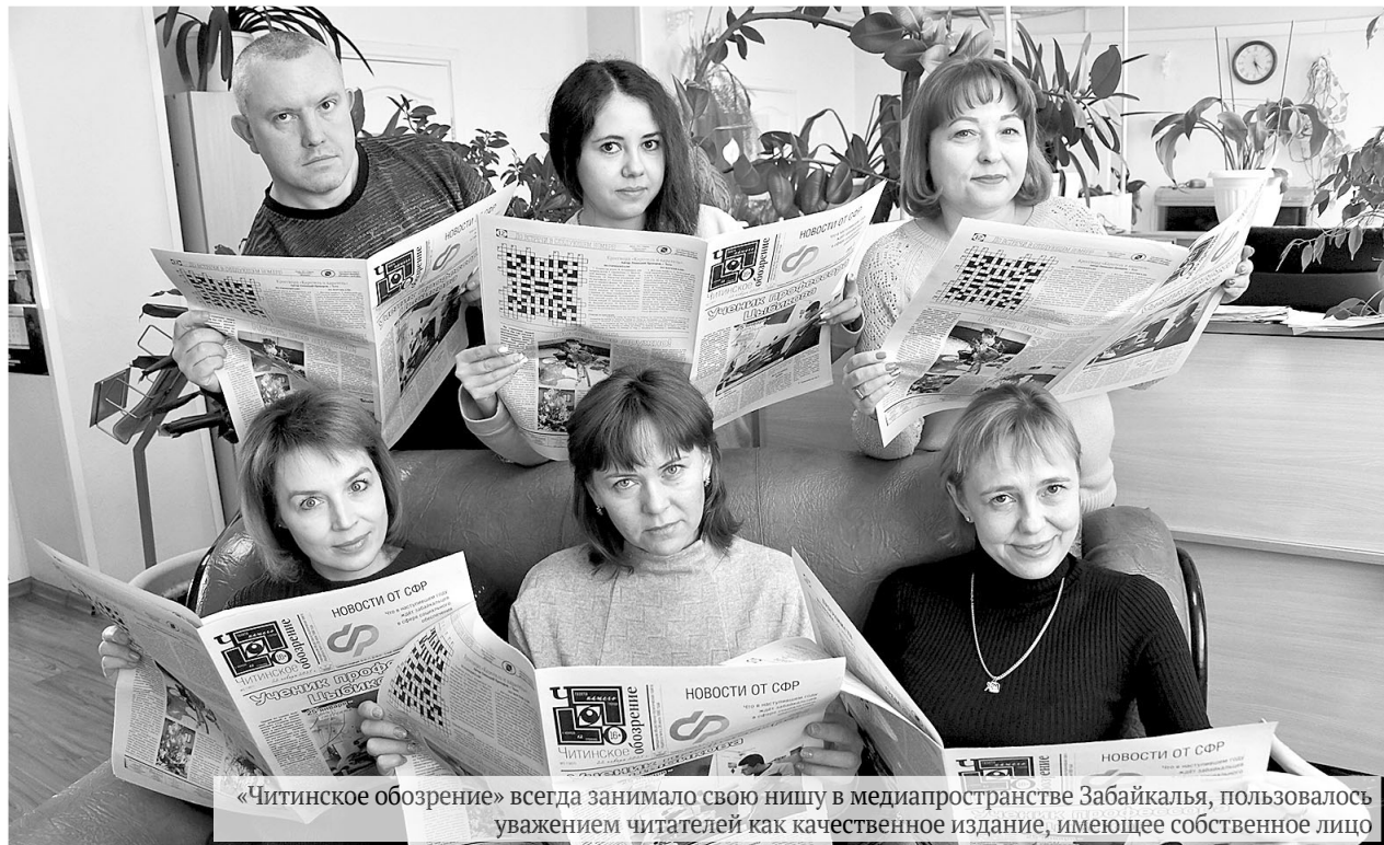
«Читинское обозрение» всегда занимало свою нишу в медиапространстве Забайкалья, пользовалось уважением читателей как качественное издание, имеющее собственное лицо