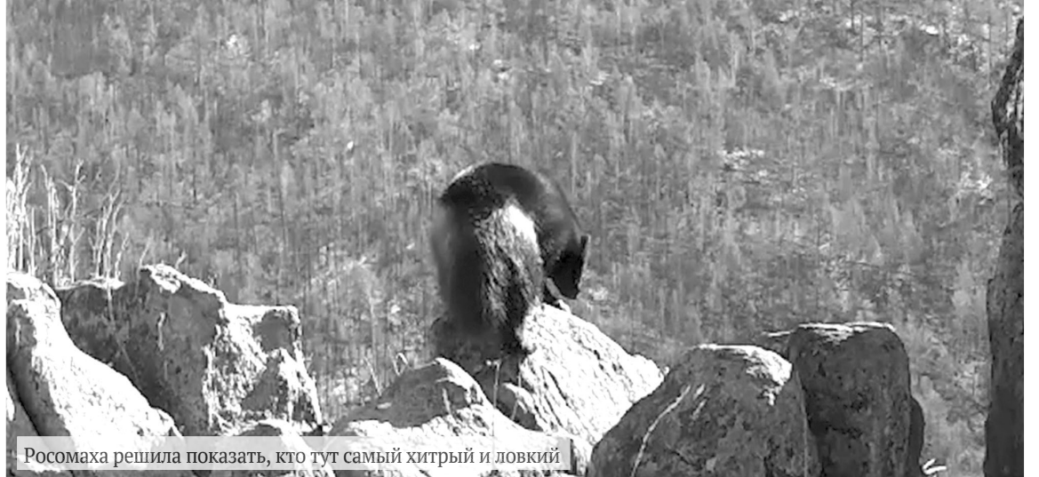
Росомаха решила показать, кто тут самый хитрый и ловкий