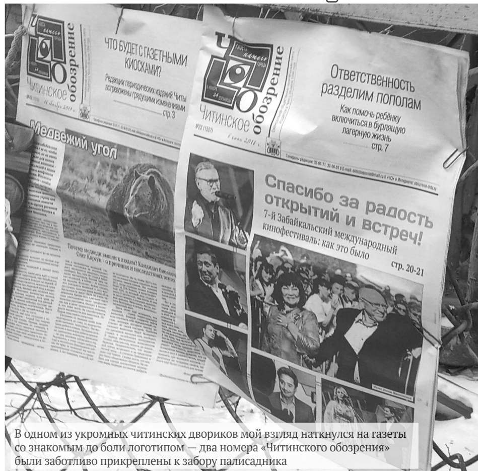
В одном из укромных читинских дворики мой взгляд наткнулся на газеты со знакомым до боли логотипом — два номера «Читинского обозрения» были заботливо прикреплены к забору палисадника

Неслучайно последнее обращение со страниц нашей газеты мы публикуем в нашей постоянной рубрике «Ниточка связи», которая стала очень востребованной среди читателей. Буквально недавно автору этих строк пришлось в очередной раз убедиться в том, что эта самая ниточка действительно существует. В одном из укромных читинских дворики мой взгляд наткнулся на газеты со знакомым до боли логотипом — два номера «Читинского обозрения» были заботливо прикреплены к забору палисадника